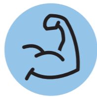
③ 운동 방법 설계

이용자의 몸상태를 파악하기 위하여 체성분을 분석하고, 기초체력을 측정한다.