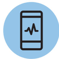
⑤ 운동결과 분석

전문 트레이너는 매 회 운동 진행에 대해 결과를 기록하고 분석하여 보다 체계적이고 점진적으로 이용자를 관리한다.