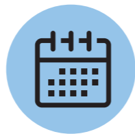
⑥ 운동 종결 및 상담

전문 트레이너는 매 회 운동 진행에 대해 결과를 기록하고 분석하여 보다 체계적이고 점진적으로 이용자를 관리한다.