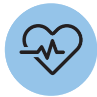
① 1:1 상담

전문 트레이너와 이용자가 1:1 상담을 진행하여 이용자의 욕구를 파악한다.