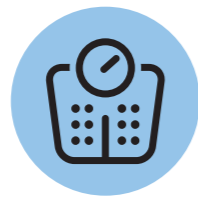
② 체성분 및 체력측정

전문 트레이너와 이용자가 1:1 상담을 진행하여 이용자의 욕구를 파악한다.